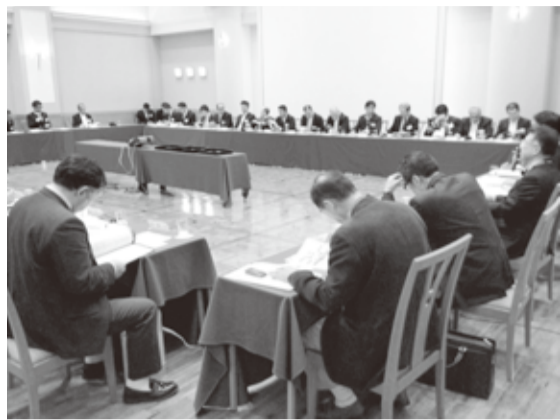
【11.15[金] 全国高校野球OBクラブ連合総会】