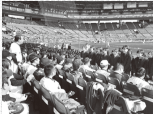
【応援演奏のボランティアの方に挨拶】