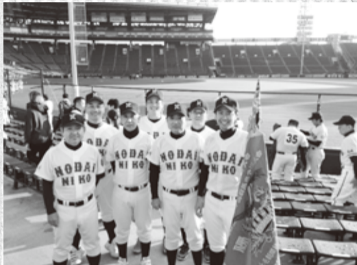
【いくつになっても甲子園は甲子園だ!!】