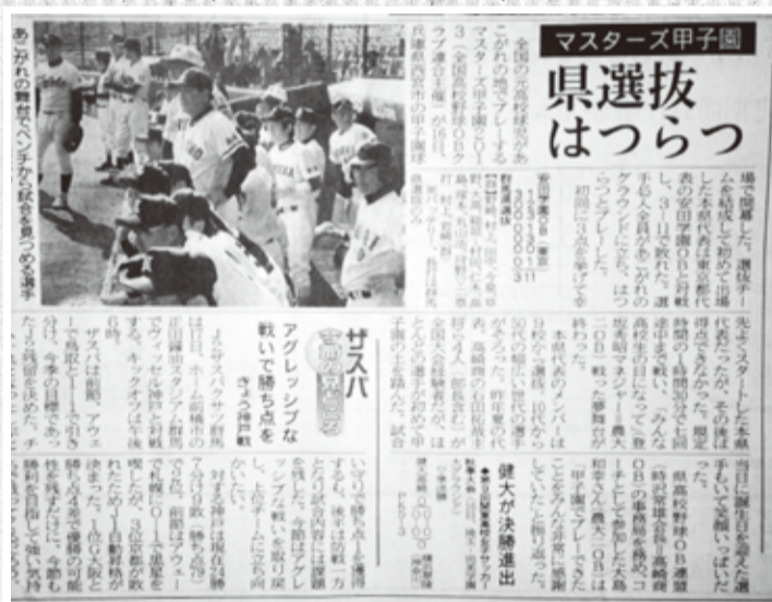
【試合翌日(11/17)の上毛新聞に掲載】

天候にも恵まれ素晴らしいコンディションの中「甲子園」でプレーをすることができた。90分という短くあたたかい時間の中、ベンチ入りした全選手が出場し、我が「群馬県選抜」は東京都代表の「安田学園OB」と対戦したが、3-11で敗れてしまった。