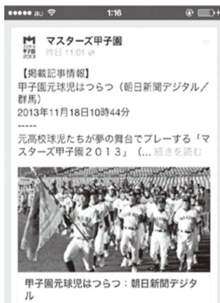
甲子園元球児はつらつ：朝日新聞デジタル

大会関係者と全出場校が参加し懇親会が開催された。対戦校とのプレゼント交換などを行い懇親を深めた。