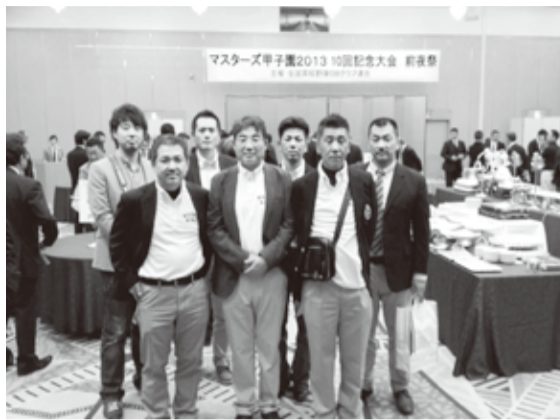
【マスターズ甲子園2013 前夜祭】